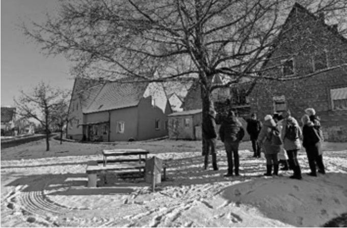
Text und Bild: Manuela Erk

Auf einen 60-minütigen Dorfrundgang durch das ca. 380 Einwohner zählende Dorf, folgte bei Kaffee und Kuchen eine angeregte Diskussionsrunde. Hier wurden und konnten viele Fragen beantwortet und neue Ideen kreiert werden. Abschließend gab es eine Führung im Fledermausmuseum, für welches Hellmitzheim bekannt ist. Mit neuen Ideen und jeder Menge Anregungen reisten wir wieder zurück nach Effeldorf und freuen uns diese nun umsetzen zu können