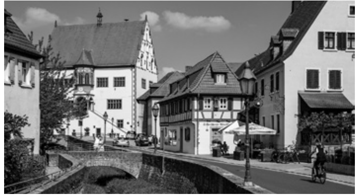
Straßenlaternen am Bach

Fraktionsübergreifend sprachen sich die Stadtratsmitglieder dann mit 17:1 Stimmen dafür aus, die Plakatierung weiter grundsätzlich überall zu erlauben. Nur das Anbringen von Plakaten an den „historischen“ Straßenlaternen im denkmalgeschützten Altstadtbereich ist künftig verboten.