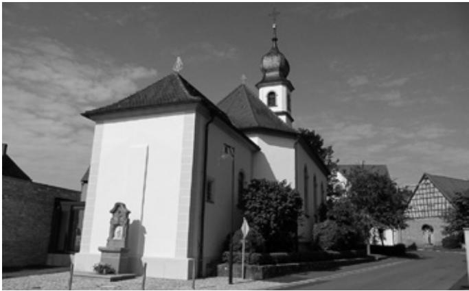
Loretokirche Effeldorf